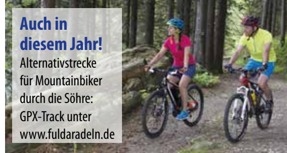
Kein Sanitätsdienst und keine Bewirtung auf dieser Strecke. Befahren auf eigene Gefahr.